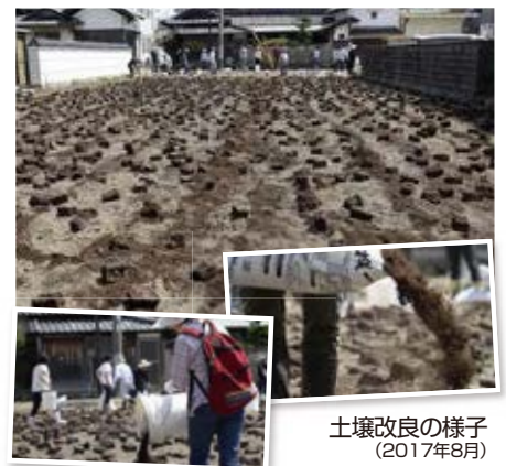
土壌改良の様子 (2017年8月)

くらし菜園の畑(SOFIX診断Bランク取得)と一般農園で、白菜の生育の様子を比較。葉の枚数、大きさともにくらし菜園の方が白菜の生育状態が良いことが見てとれます。